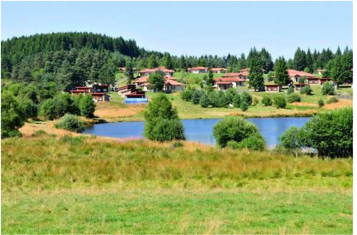
Village Club de FOURNOLS