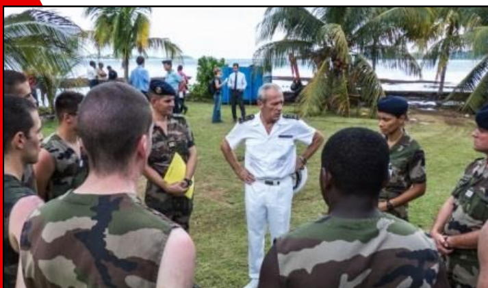
Le contre-amiral commandant les FAAs