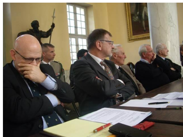
Une assemblée attentive