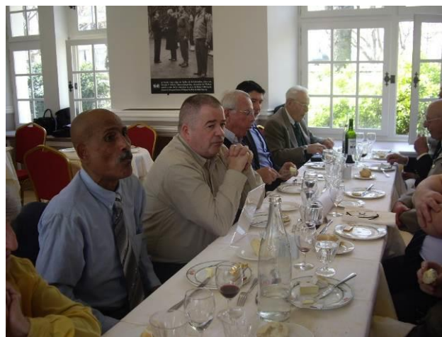
Une assemblée intergénérationnelle