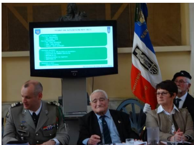
L'intervention du chef de Corps