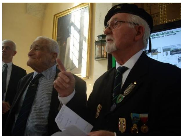
Notre porte-drapeau à l'honneur