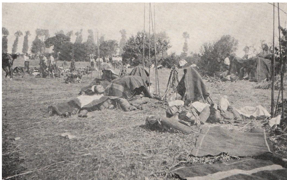
Bivouac du 2 ème escadron Sartout à Rupt-sur-Othain au soir de la charge de Marville le 10 août 1914

Dès maintenant le régiment est au contact de l'ennemi qu'il maintient étroitement. Toutes les opérations de cette période sont les préliminaires de la bataille de Virton.