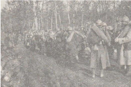
L'escadron de Kergorlay, monte en lignes en Forêt de Parroy au nord-est de Lunéville (janvier 1916).

Forêt de Paroy. — À la fin d'octobre, la division se porte dans la région de Lunéville pour tenir un secteur de tranchée. Le régiment occupe les lisières de la forêt de Parroy. Les positions sont intégralement maintenues pendant tout l'hiver et jusqu'au mois de mai 1916.