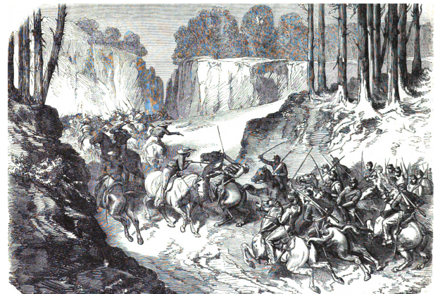
Mort du commandant Aymard DE FOUCAULT