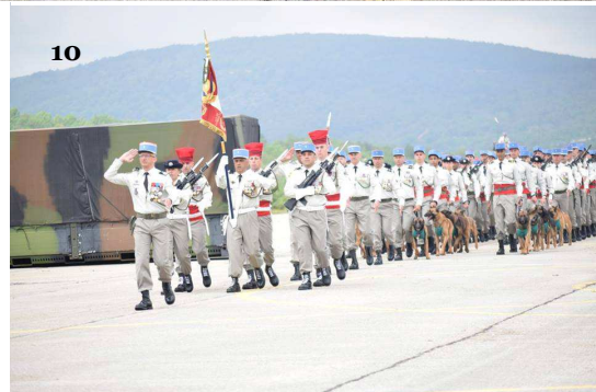
1 et 2 : Les porte-drapeaux à l'entrée de la Chapelle et à l'intérieur / 3, 4 et 5 : Dépôt de gerbes à la stèle des régiments et à la stèle du 1 er RCA / 6 : Remise de décorations / 7 : Autorités civiles et militaires / 8 : Étendard pris aux mexicains suivi de celui du 1 er RCA, à gauche le président de l'Amicale du 1 RCA / 9 et 10 : Défilé