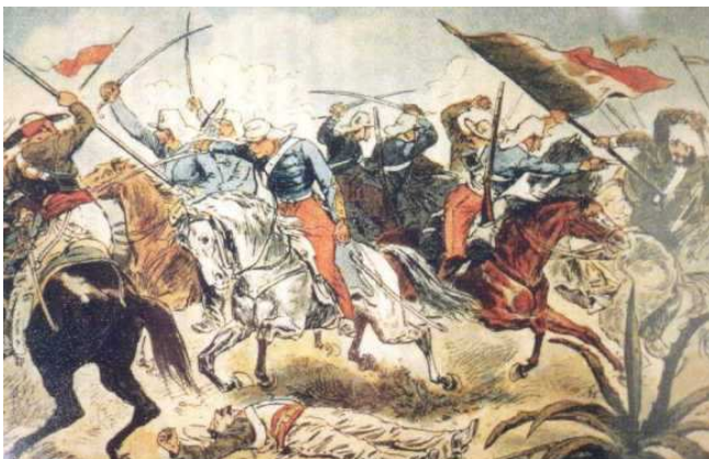
Prise de l'étendard des Lanciers du Durango