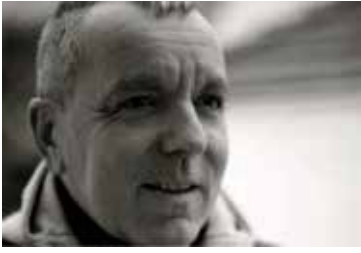
JACQUES RAVELEAU-DUPARC Auteur, compositeur et interprète