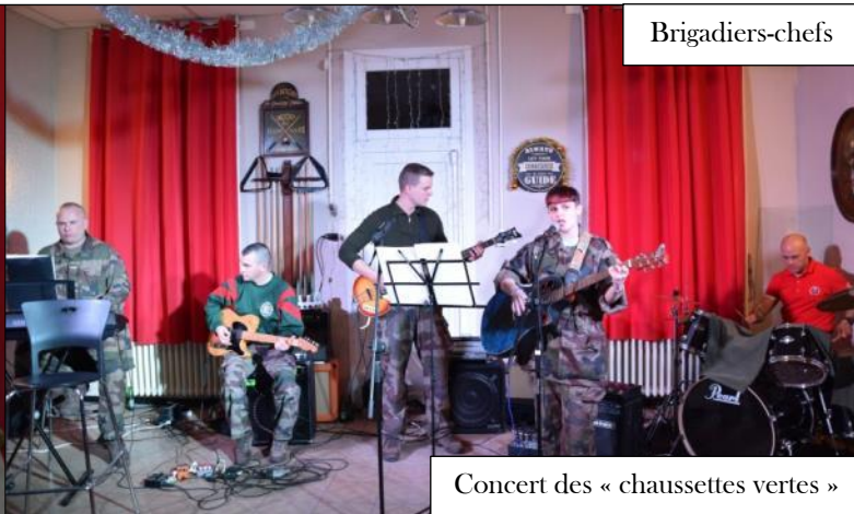
Concert des « chaussettes vertes »