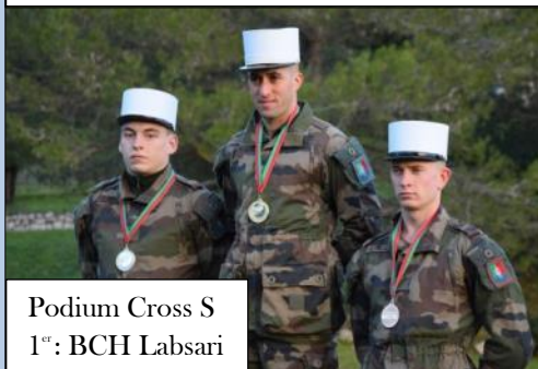
Podium Cross S 1 er : BCH Labsari