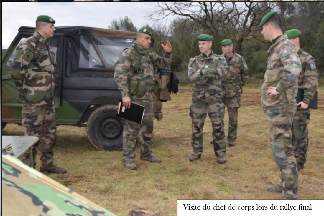
Visite du chef de corps lors du rallye final