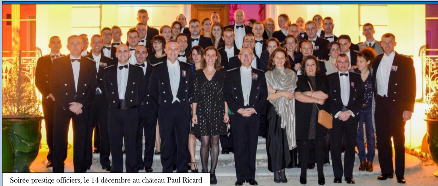
Soirée prestige officiers, le 14 décembre au château Paul Ricard