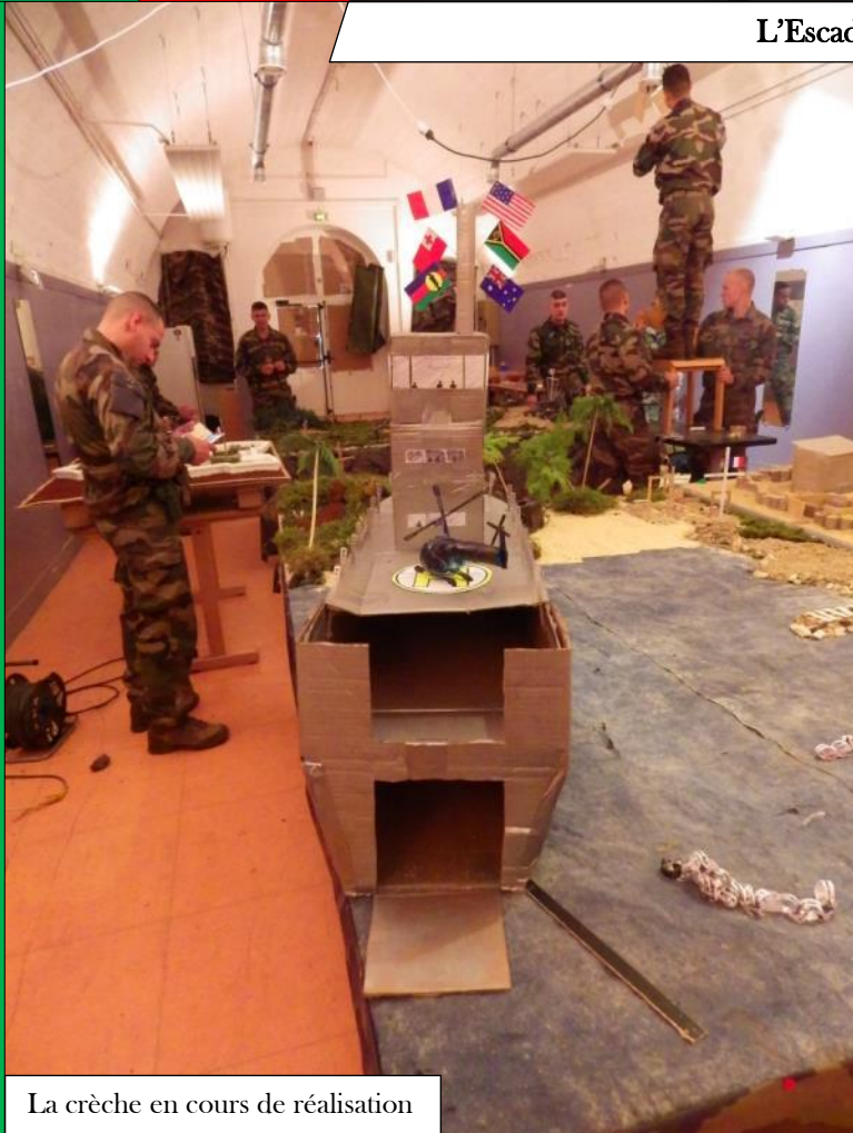
La crèche en cours de réalisation

Déployé dans le cadre de l'opération Sentinelle, le 3 e Escadron a eu à cœur de se réunir pour les festivités de Noël dans la plus pure tradition légionnaire.