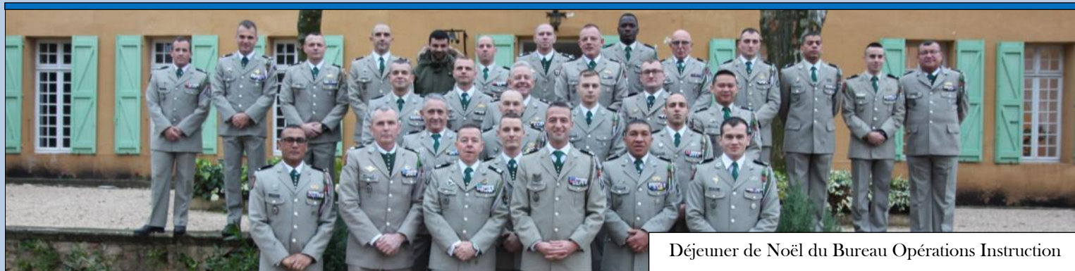
Déjeuner de Noël du Bureau Opérations Instruction