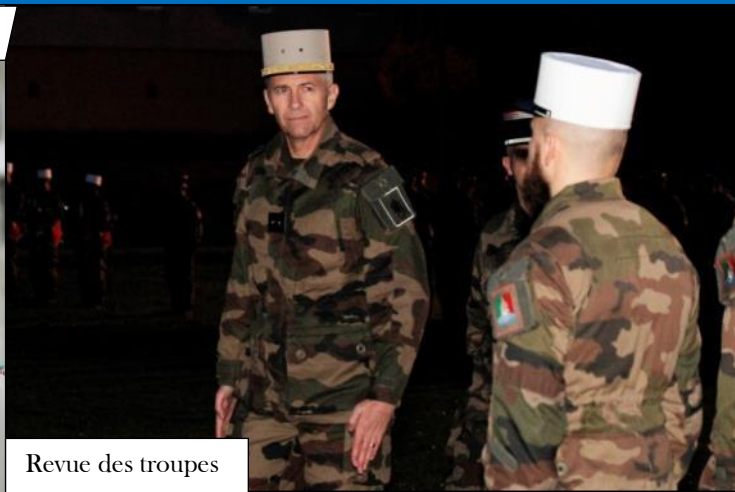
Revue des troupes