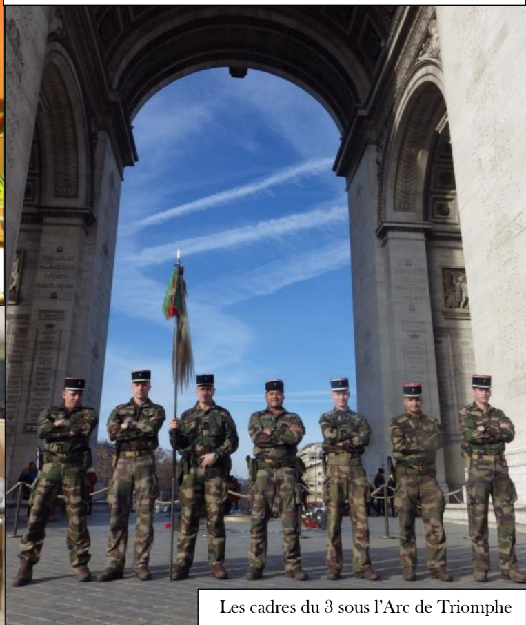
Les cadres du 3 sous l'Arc de Triomphe