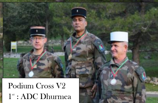
Podium Cross V2 1 er : ADC Dhurmea