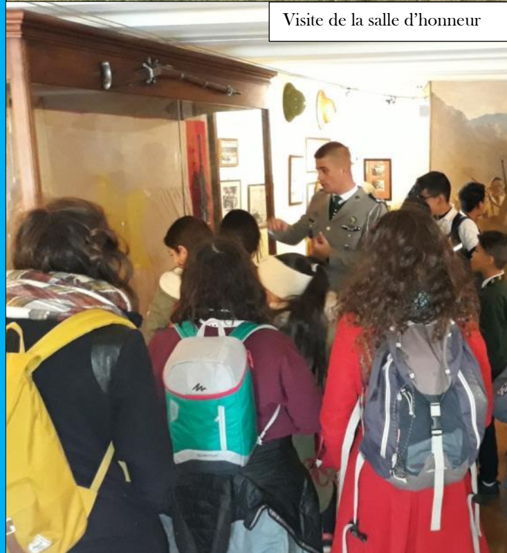
Visite de la salle d'honneur