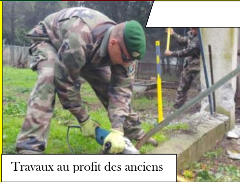
Travaux au profit des anciens