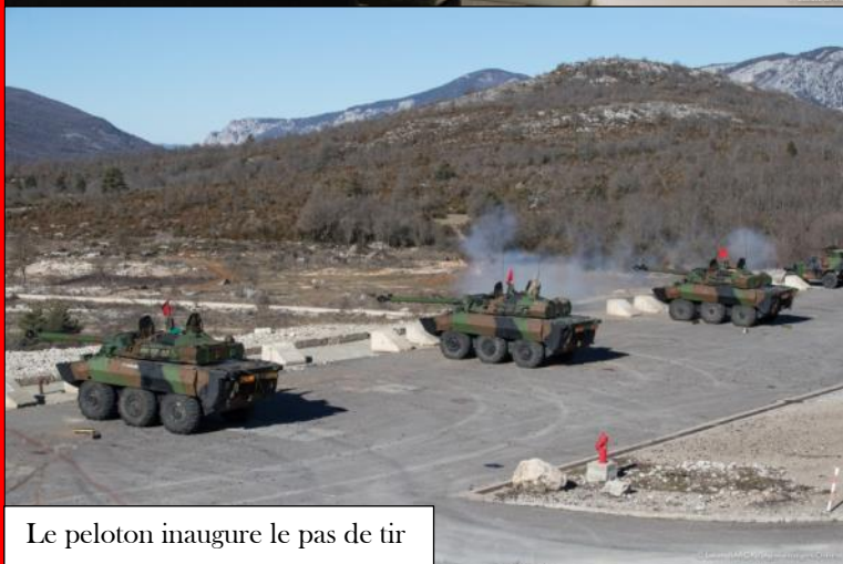
Le peloton inaugure le pas de tir