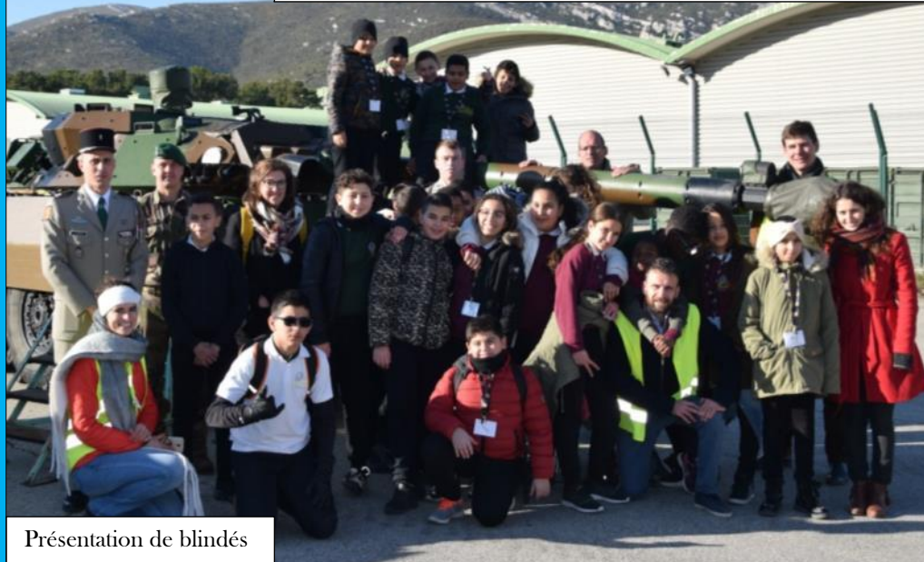
Présentation de blindés

Le jeudi 24 janvier 2019, le 4 e Escadron a accueilli sur le camp de Carpiagne, une vingtaine d'enfants de l'association « Espérance banlieues » pour leur montrer la vie et les spécificités du métier de militaire.