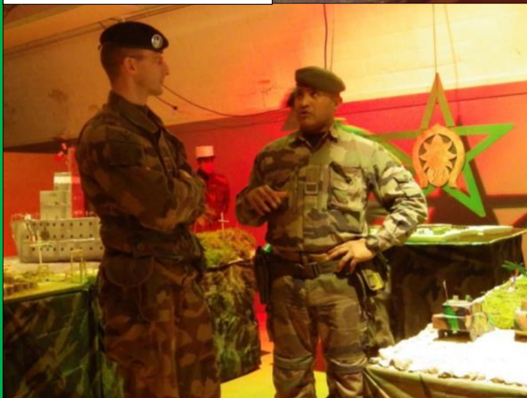
Veillée de Noël

L'escadron a également eu l'honneur de recevoir la visite d'autorités qui ont pu voir l'unité travailler, échanger avec les cadres et légionnaires et admirer la crèche. Ainsi, le général commandant la DIRISI, les chefs de corps du 516 e RT, du RMED et du 24 e RI, ainsi que le chef d'état-major de l'opération Sentinelle ont été émerveillés par les détails de la réalisation et par les astuces employées dans la crèche des sentinelles du Rif.