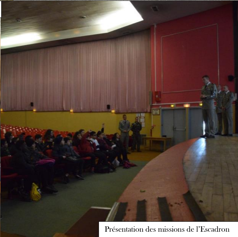
Présentation des missions de l'Escadron