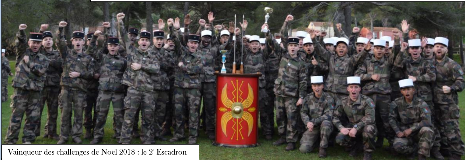
Vainqueur des challenges de Noël 2018 : le 2 e Escadron