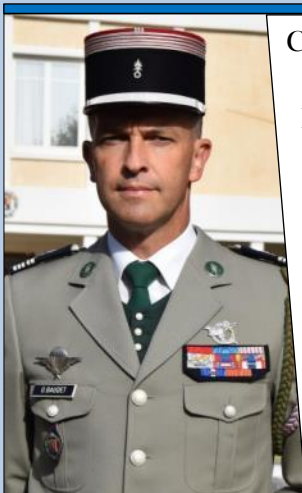
L'édito du Chef de Corps