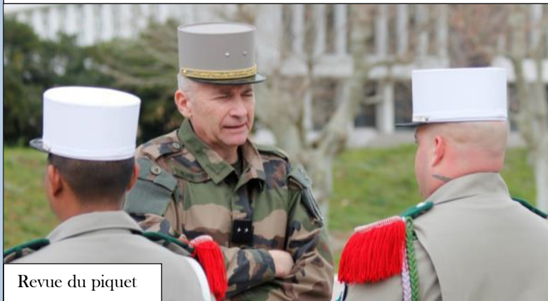
Revue du piquet