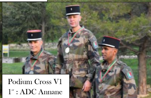
Podium Cross V1 1 er : ADC Annane