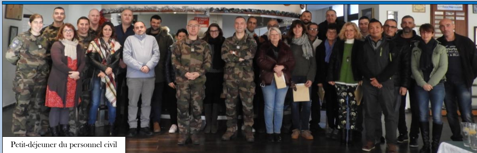
Petit-déjeuner du personnel civil