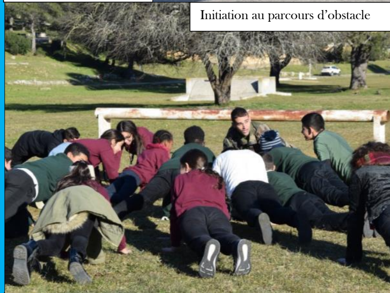
Initiation au parcours d'obstacle

Autant de valeurs que nous partageons avec eux et grâce auxquelles les cadres et légionnaires du 4 ont eu plaisir de partager leur passion du métier avec ces enfants.