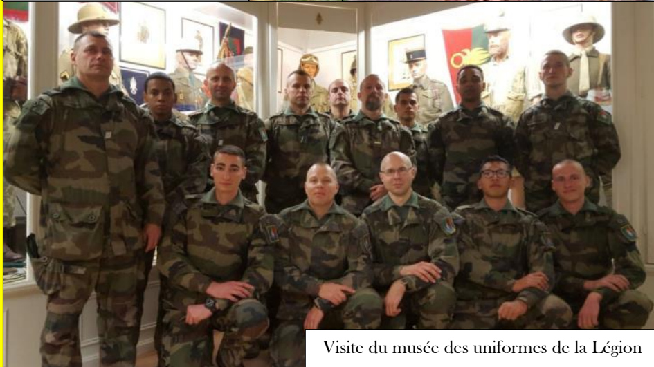
Visite du musée des uniformes de la Légion

Après ces travaux, les réservistes ont profité des possibilités d'instruction offertes par le domaine capitaine Danjou pour parfaire leur maîtrise des savoir-faire spécifiques à la mission Sentinelle.