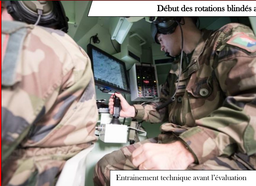
Entraînement technique avant l'évaluation

Sous commandement d'un sous-groupe tactique interarmes (SGTIA) à dominante infanterie du 2 e REI, le 1 er peloton du 2 e Escadron a eu la chance d'inaugurer le nouveau centre d'évaluation tactique interarmes (CETIA) Opéra du 1 er Régiment de chasseurs d'Afrique à Canjuers.