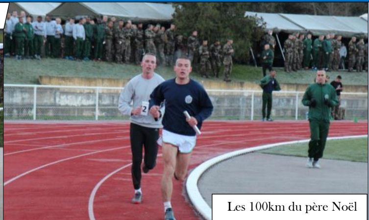
Les 100km du père Noël

4 épreuves ont vu s'affronter les unités présentes : des tournois de football et de handball, avec en fil rouge « les 100km du père Noël », réalisés par équipes qui courraient une succession de 2000m.