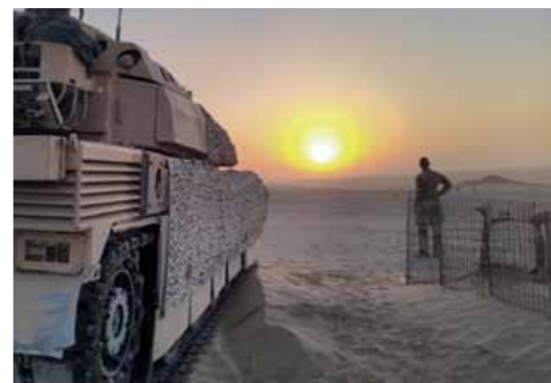
Aguerissement dans le désert.