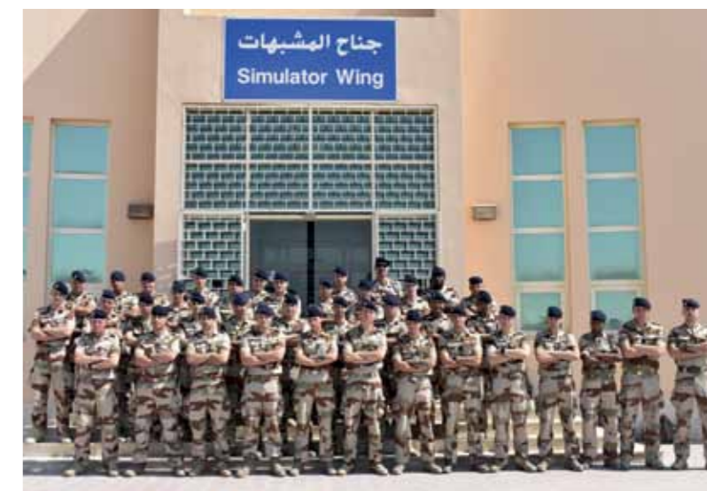
Nos Dragons devant le bâtiment du simulateur aérien.