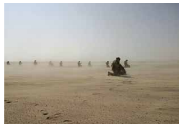
Desserrement du SGTIA blindé sur l'héliport.