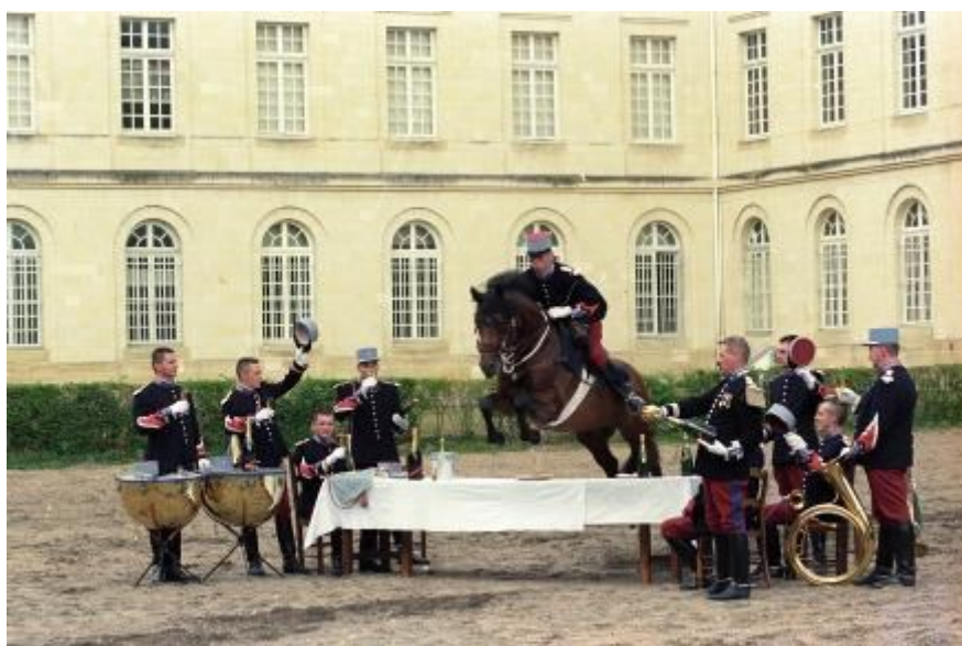
Le saut de la table par la fanfare de la cavalerie reproduisant une aquarelle d'Eu- gène LELIÈVRE

Dessin publié dans la revue Saumur de l'ANORABC