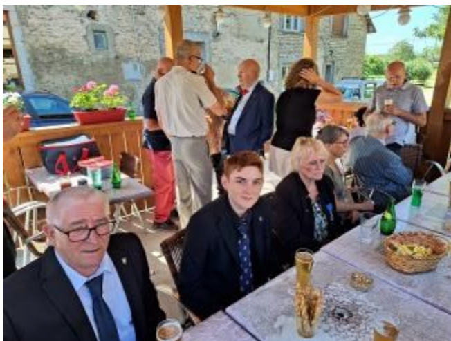
Le traditionnel pot de l'amitié a permis des retrouvailles, et des adhésions à l'amicale.

« Le seul devoir de mémoire, c'est d'enseigner et de transmettre » Simone Veil