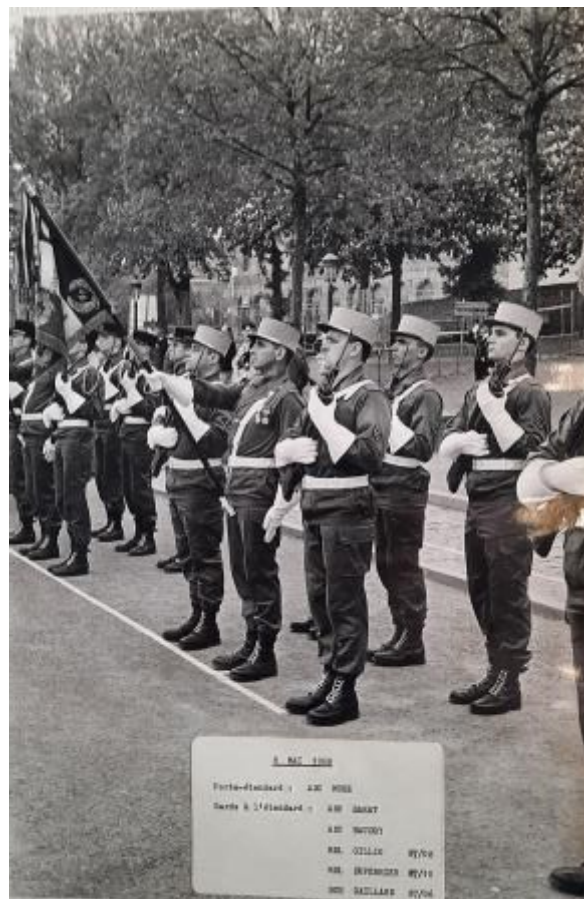
La garde à l'étendard le 8 mai 1988