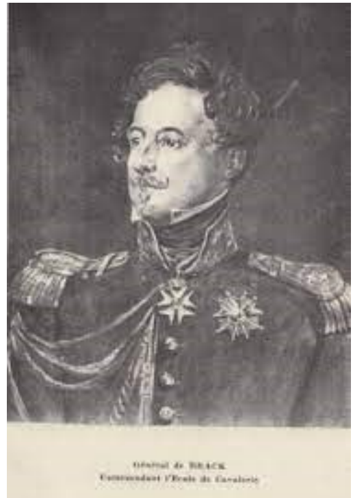
Colonel Antoine Fortuné de BRACK 1832