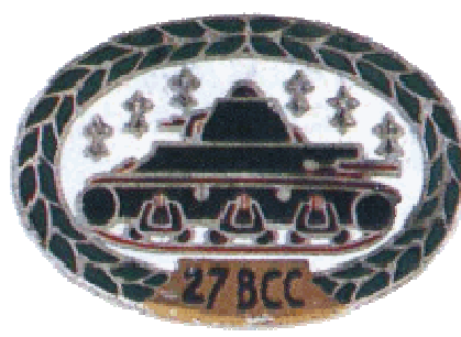
27 ème BCC