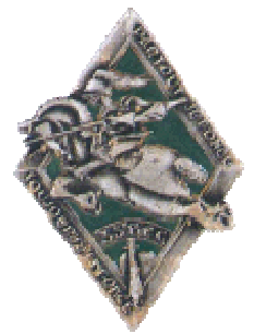
35 ème BCC