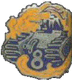
8 ème BCC