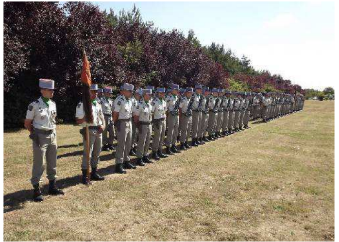
Le 12 e Régiment de Cuirassiers rassemblé

La prise d'armes a débuté à 11H00 ; le chef de corps du 12 a honoré le 1 er Cuirassiers en ne faisant participer à la prise d'armes que l'étendard du Turenne-Cavalerie, sorti de Vincennes pour l'occasion. Après un hommage rendu au chasseur du RCP mort quelques jours auparavant en Afghanistan, il y a eu une remise de décoration à trois cadres puis l'adieu aux armes d'un capitaine du régiment.