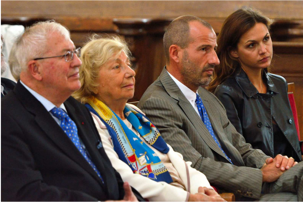
Le famille de La Tour d'Auvergne lors de la messe en Saint-Louis des Invalides