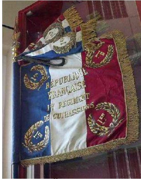
L'étendard du 1 er Régiment de Cuirassiers