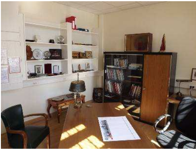
Bureau des Amicales

Après un accueil des participants au cercle du régiment, une messe était célébrée vers 9H45 par l'aumônier de la garnison d'Orléans dans la salle St Georges. Les invités se sont dirigés ensuite vers le bâtiment PC du 12 e R.C. pour visiter la "Maison des Cuirassiers" : un bureau pour les amicales et 4 salles (indépendantes de la salle d'honneur du régiment) qui permettront d'exposer des souvenirs des 11 régiments dissous.