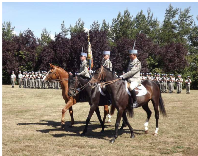
La Garde à l'étendard

Les photos ci-dessus relatives à la prise d'armes d'Olivet ont été prises par le Lieutenant Bureau de l'UNABCC L'amicale le remercie bien vivement.