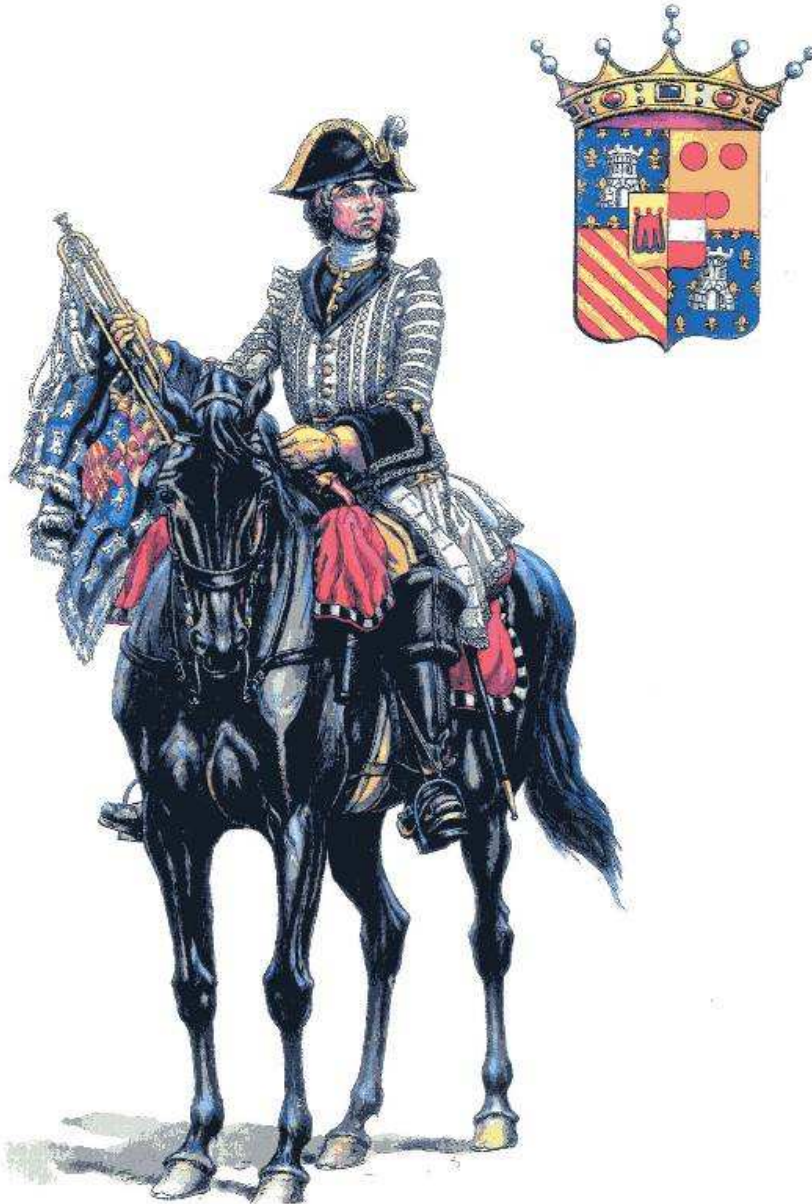
Benigni - Trompette en livrée de M. de Turenne