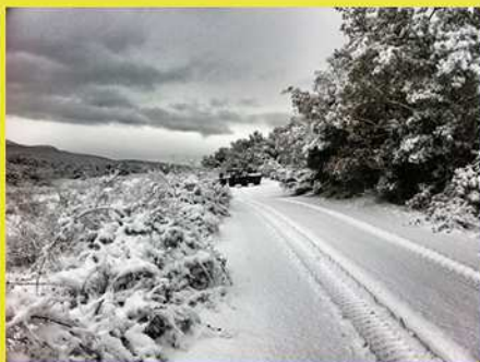
Les DLA se préparent pour le Mali... dans la neige !